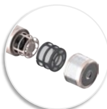
Съёмный магнитный фильтр для легкой очистки