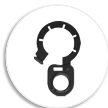
Съемное кольцо для подвешивания