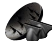
2 узкие насадки-концентраторы (4 и 8 мм) и диффузор в комплекте