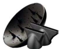
2 узкие насадки-концентраторы (4 и 8 мм) и диффузор в комплекте