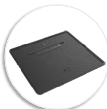
Smart коврик (с режимом ожидания)