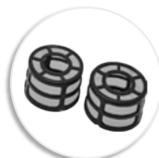
2 запасных фильтра