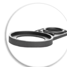
Съемное кольцо для подвешивания