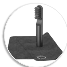
Набор для очистки