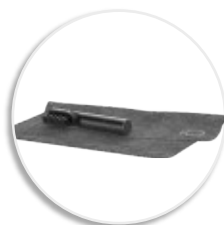
Набор для очистки