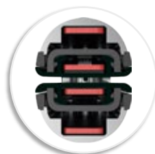
4 нагреваемые поверхности