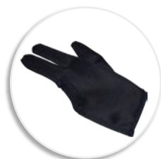
Термозащитная перчатка в комплекте