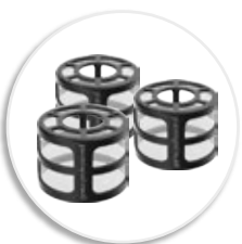
3 запасных фильтра