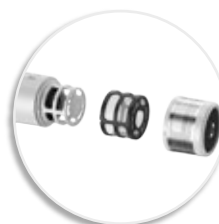
Съёмный фильтр для легкой очистки