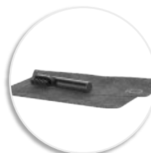
Набор для очистки